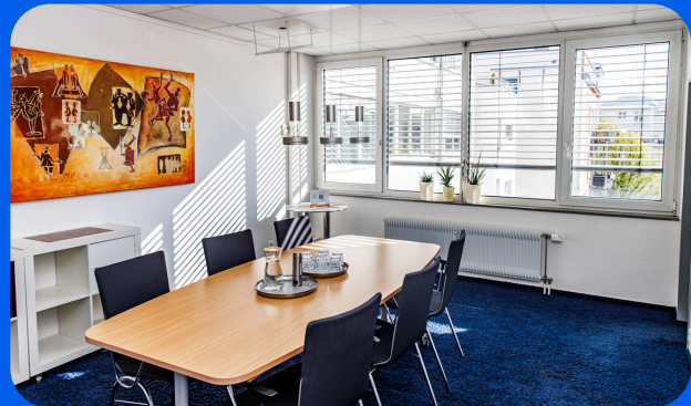
Konferenzraum (in Miete inkl.)