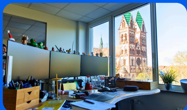
Ausblick auf Stühlinger Kirchplatz